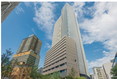
▲赤坂インターシティ AIR