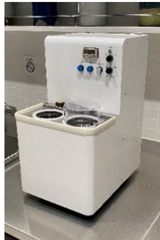
▲象印マイボトル洗浄機