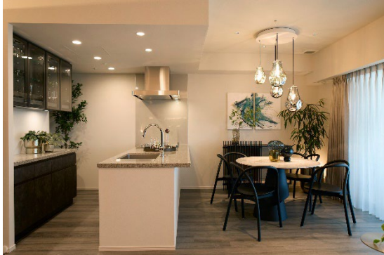
▲改修したサンプルルーム

人件費、資材費、用地費の上昇などを背景に販売価格が高騰している状況を受け、本サロンにおいても一部高額価格帯の物件販売を行うこととし、接客スペースやサンプルルームなどについて、高額価格帯に合わせた仕様に改修を行いました。