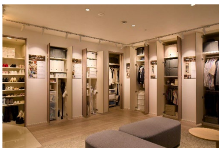
▲リビオアイデアズ収納展示

リビオは毎年、社員自らが赴く入居者訪問インタビューやアンケート調査で集められたお客さまの声を商品企画へ反映しています。生活していく中で“あったらいい”を各ポイントに落とし込み、住まう方目線のマンションづくりを実現します。“選ぶとき、買うとき、住み始めたとき、住んだあとの暮らし”など、マンションとの出会いから暮らしまで、マンションでの日々のさまざまなシーンを生活者視点で見つめ、商品企画を行っています。