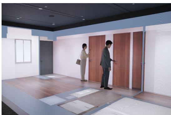
▲リアルサイズスクリーン

この度、さらなる体験価値の向上を目指し、業界で初めて「Apple Vision Pro」を用いて投影された実寸大の間取りに家具などの配置もリアルに体感することが可能な MR 体験アプリケーションを開発し、実証実験を開始いたします。これにより、本スクリーンに投影された間取りに対し、家具の配置を重ね合わせる没入感の高いリアルな MR 体験が可能になります。今後実証実験を重ね、2024 年 10 月以降のお客さまへの案内開始を予定しています。