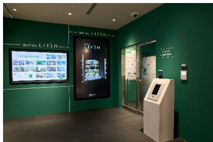
▲新設したリビオ紹介スペース