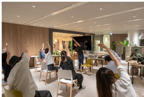
▲過去の入居者さま・契約者さま向けイベント