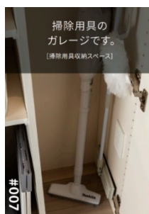
▲リビオアイデアズの一例