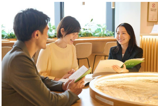
▲ライフデザイナーへのご相談

本サロンでは、契約者さま・入居者さまに暮らしを豊かにするきっかけを提供すべく、毎月さまざまなイベントを開催しており、今後もさらなる拡充を図ってまいります。また、本サロンに常駐するライフデザイナー（コンシェルジュ）が、首都圏エリアの物件に加えて関西エリアや九州エリアの物件もご紹介できるよう人員体制強化を図っております。