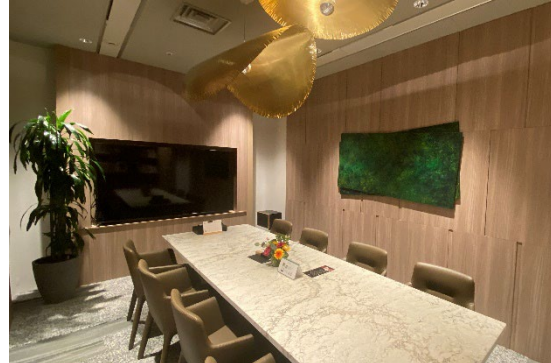
▲改修した接客スペース