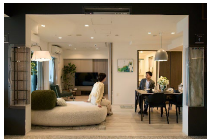
▲改修したサンプルルーム